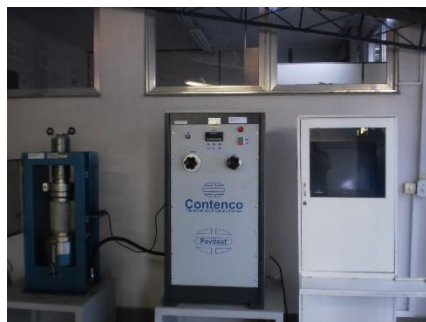
Melhorias nos laboratórios técnicos - campus Nova Iguaçu