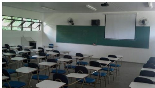
Sala de aula com carteiras estofadas e data show - campus Barra do Pirai