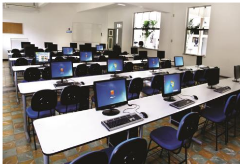
Modernas Instalações - campus Barra do Pirai