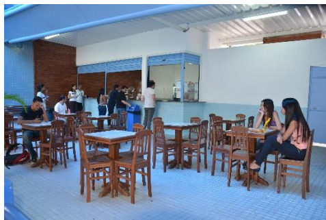
Novas instalações e nova gestão da cantina – campus Volta Redonda