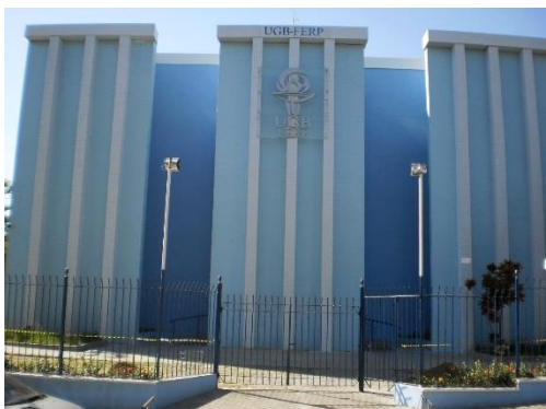
Nova fachada do prédio – campus Nova Iguaçu